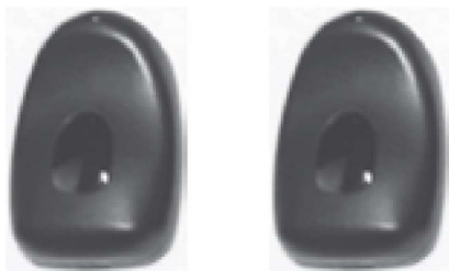
Art. MT-08 Juego de celulas fotoeléctricas externas de rayos infrarojos modulados con un alcance normal de 8 mts.