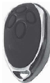
Art. MT-07 Mando 4C "Automatico" easy cromado