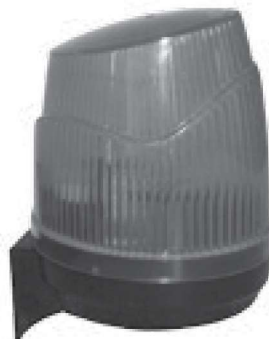
Art. MT-15 Lampara destellante